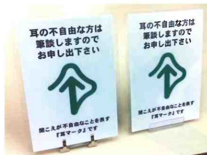
ステンレス台 (左) プラスチック台 (右)