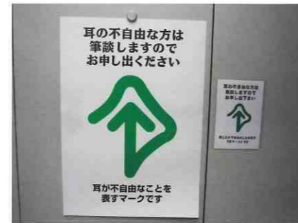
ポスター (左) 表示板用カード (右)